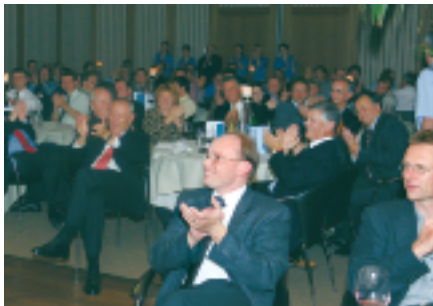
von Nubya begeistertes Publikum